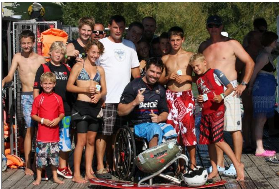
En 2010, le sportif a déjà réalisé un tour du monde pour montrer que « les handicapés sont comme les autres ».